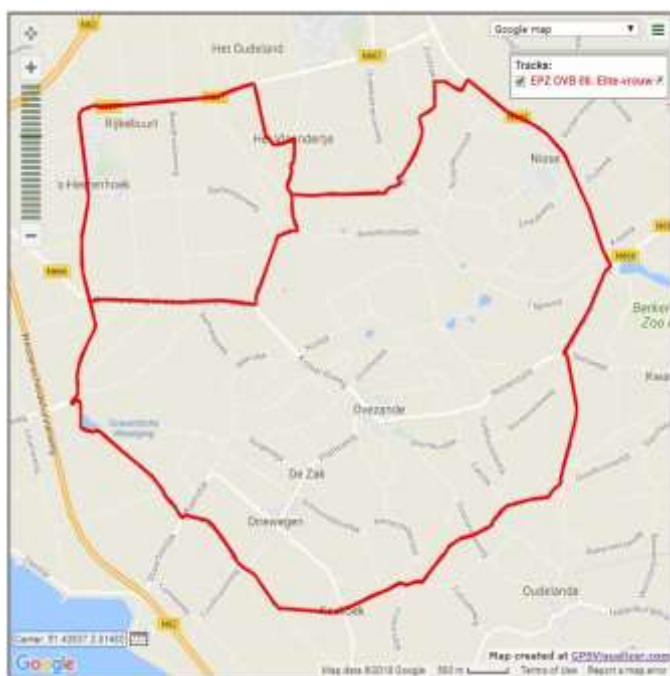
Routekaart: Junior Vrouwen op zaterdag 20 april

Cycling races held on the Saturday and Sunday will be driven on a partially fenced in track. The caravan will be accompanied by front row cars, police, motorcyclists MBTZ. For the whole route, this is closed at the time of passing of the caravan. Start of the closure will be indicated by the sound truck and police escort. Trained traffic controllers will then shut down the road. This closure will be maintained until caravan completely passes the deposited road section. This end of the caravan will always be indicated by the so called broom-wagon.