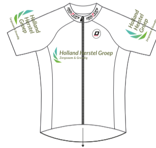
Jongerentruui Holland Herstel Groep