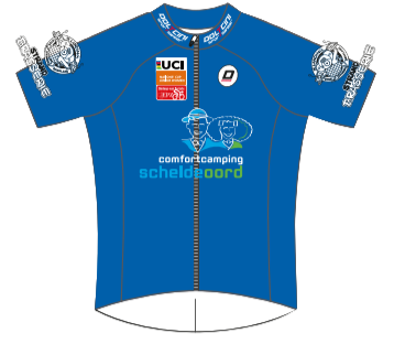
Puntenstrui Scheldeoord / de Landing